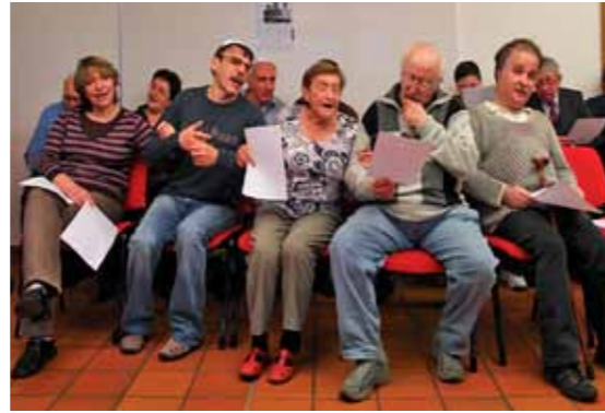
Gute Stimmung mit Gesang