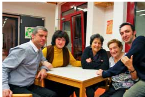
Mitglieder des Betreuer-Teams