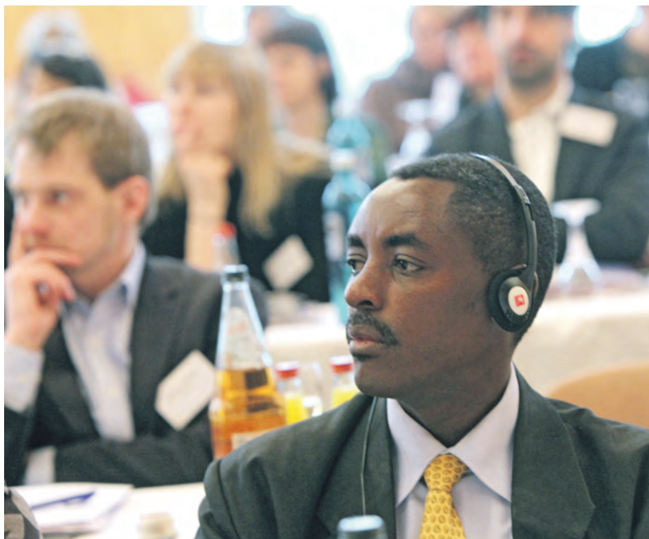
Auch in Ruanda will man wissen, wie man Opfern des Völkermords helfen kann.

GEFAHR Als Dreijährige in einem Korb von schmutziger Wäsche versteckt, immer mit der Angst, keinen Laut von sich geben zu dürfen, um nicht entdeckt zu werden. Versteckte hinter einem Kleiderschrank, ein ständiges Umherziehen, Überleben in selbst gebauten Bunkern im Wald, die Erinnerungen der Kinder, die überlebt haben, und heute 70 oder 80 Jahre alt sind, haben ihr Leben geprägt. Ein Phänomen, das beantwortet, warum man sich auch