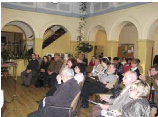
Aufmerksame Zuhörer im Lichthof

Anthologien stehen nicht gerade im Mittelpunkt des allgemeinen literarischen Interesses. Wer sie dennoch produziert, weiss auch, dass sie keine Kassenschlager werden. Trotz solcher Unwägbarkeiten legen die „Literarisch-künstlerische Werkstatt“ beim Begegnungszentrum Kibuz und das Literaturkollegium Brandenburg jetzt ihre dritte gemeinsame Publikation vor. Der Titel „Silhouetten“ will auf Um- und Schattenrisse verweisen, will also auf Menschenwege und Menschenschicksale neugierig machen: „Je bewusster wir ihnen folgen, umso näher kommen wir einander“; heißt es im Vorwort. Ein Traum nur, vielleicht. Die Autoren jedenfalls wissen, wovon sie schreiben, Kibuz vereint ja in der Berliner Straße vor allem russisch-jüdische Einwanderer.