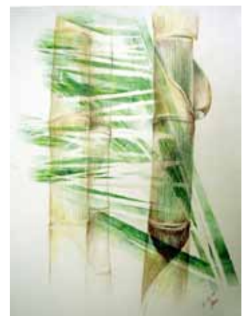
Bambus Mischtechnik, 70 x 50, Michael Bensman

Neben Ausstellungen in den Galerieräumen in der Oranienburger Straße ist die Jüdische Galerie derzeit aktiv auf der Suche nach Partnern, um ihre Kunst in zusätzlichen Ausstellungsräumen in Berlin und auch in weiteren deutschen Städten zu zeigen. Es ist das grosse Interesse der Jüdischen Galerie, ein breiteres kunstinteressiertes Publikum anzusprechen.