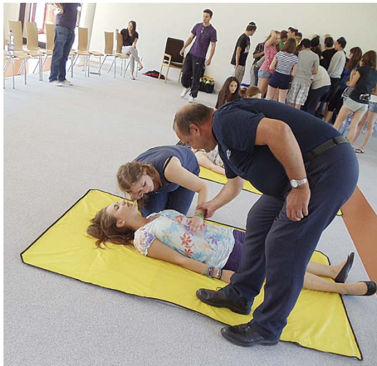
Gehört auch zum Seminar: Erste-Hilfe-Kurs

Höhepunkt der Ausbildung ist ein zweiwöchiges Seminar in den Winterferien. Hier haben die Teilnehmer die Möglichkeit, die erlernten Fertigkeiten in praktischen Simulationen zu üben und zu vertiefen (s. Bericht Ausgabe April/2011). Nach Abschluss der Seminarreihe erhält jeder Jugendliche ein anerkanntes Zertifikat der ZWST.