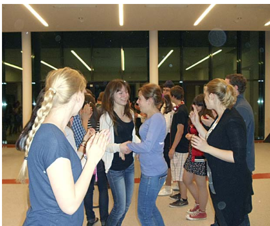
Wie vermittele ich israelische Tänze an die Kinder in meiner Gemeinde? („Jüdische Tänze lernen“ mit Olha Dimov, ZWST)