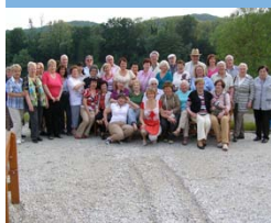
Klub Kiew unterwegs