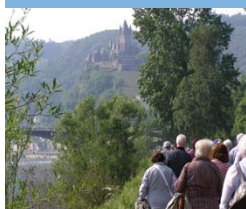
Auf dem Weg zur Burg Eltz