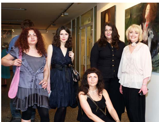
Die Künstlerinnen, v.li.:

Ausstellungsort: Jüdische Gemeinde zu Berlin, Fasanenstr. 79-80, 10623 Berlin Öffnungszeiten: Mo – Do 10:00 – 18:00 Uhr Fr 10:00 – 13:00 Uhr So 11:00 – 15:00 Uhr