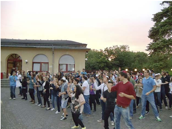
Einstudieren von Tänzen für die Machanot

Diese Fragen waren der Auftakt zum ersten von insgesamt 5 Praktikantenseminaren Anfang Februar in Bad Sobernheim. Im Juni 2011 wurden Teil III und IV der Seminarreihe erfolgreich abgeschlossen. 70 Teilnehmer aus mehr als 20 jüdischen Gemeinden bundesweit stellen sich der anstrengenden, aber lehrreichen Aufgabe, zukünftig als Madrichim im Jugendzentrum oder auf den Sommer- und Wintermahanot der ZWST Verantwortung zu übernehmen.