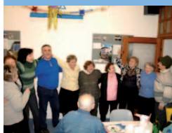
Städteklub „Treffen an der Newa“